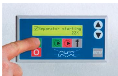
ALFIE 500 – Panneau de commande.