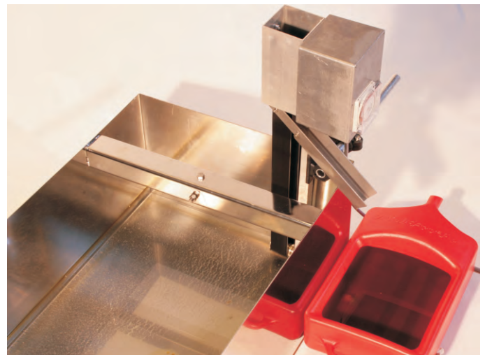
Après quelques minutes d'utilisation, la surface est débarrassée de l'huile